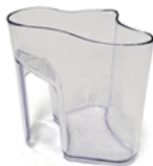
CONTENEDOR DE JUGO Y PULPA